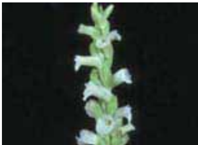
Detall de l'espiga de flors Autor: Josep M a Vidal

Planta herbàcia perenne de 12 a 40 cm d'alçària. Arrels carnosos, amb 2-4 tubercles que l'hi permeten mantenir-se enterrada durant l'època desfavorable. Flors lleugerament flairoses en espiga estreta i densa, disposades de forma helicoidal.