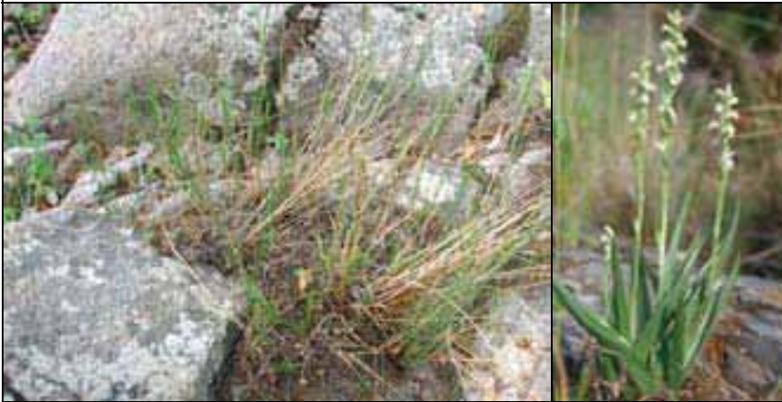
Aspecte general de l'hàbitat, a la llera del Riu Daró/ Port general