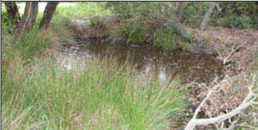
Aspecte general de l'hàbitat a la Bassa del Mas Estanyet