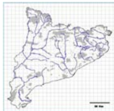
Segons Cartografia dels hàbitats de Catalunya (CH)

Aquest hàbitat és ben representat dins l'espai. La gran ocupació del territori en els darrers segles ha portat a una distribució dispersa en el conjunt de l'espai, amb alguns punts de major concentració com el sector de Fitor, els Metges, i Sant Cebrià dels Alls on hi trobem tres de les antigues parròquies. En el corresponent mapa de distribució es mostren les localitats mitjançant punts. Cal fer notar el gran nombre de punts representatius d'aquest hàbitat. És un hàbitat azonal, que no depèn pròpiament de les característiques climatològiques dominants al territori, ja que rep aportacions extres d'aigua dels ambients circumdants.